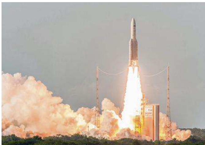
Vernon compte parmi ses entreprises de taille mondiale le constructeur de moteurs de fusée qui équipe le lanceur européen Ariane